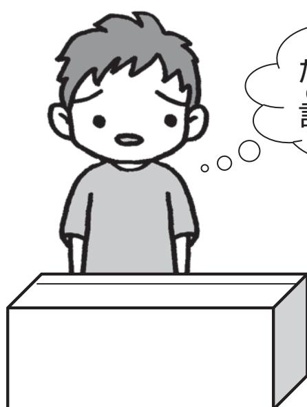
やすひろくん (こまった 90)